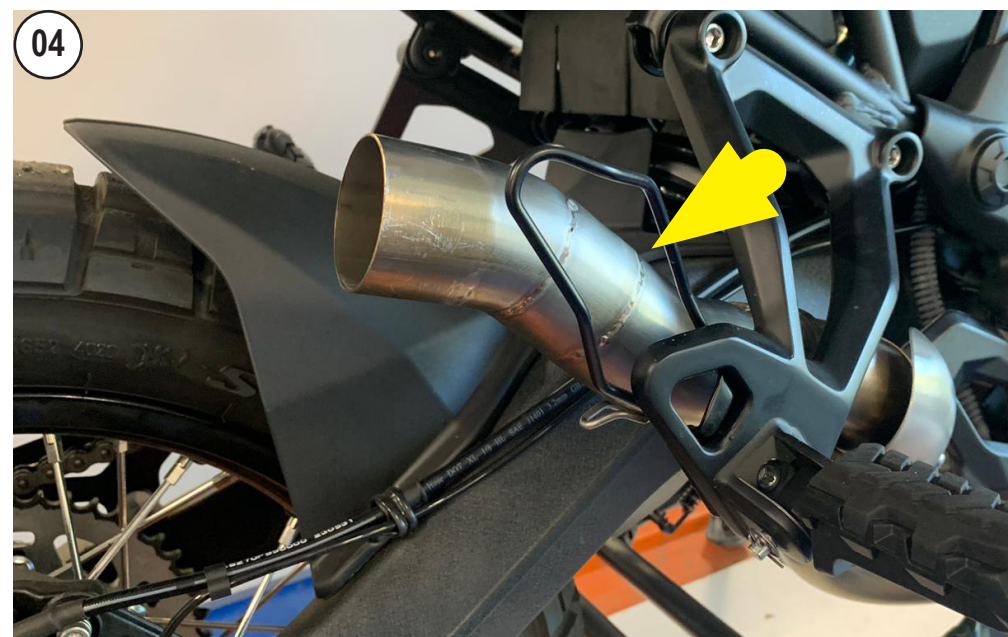
INSTALL THE LeoVINCE PIPE