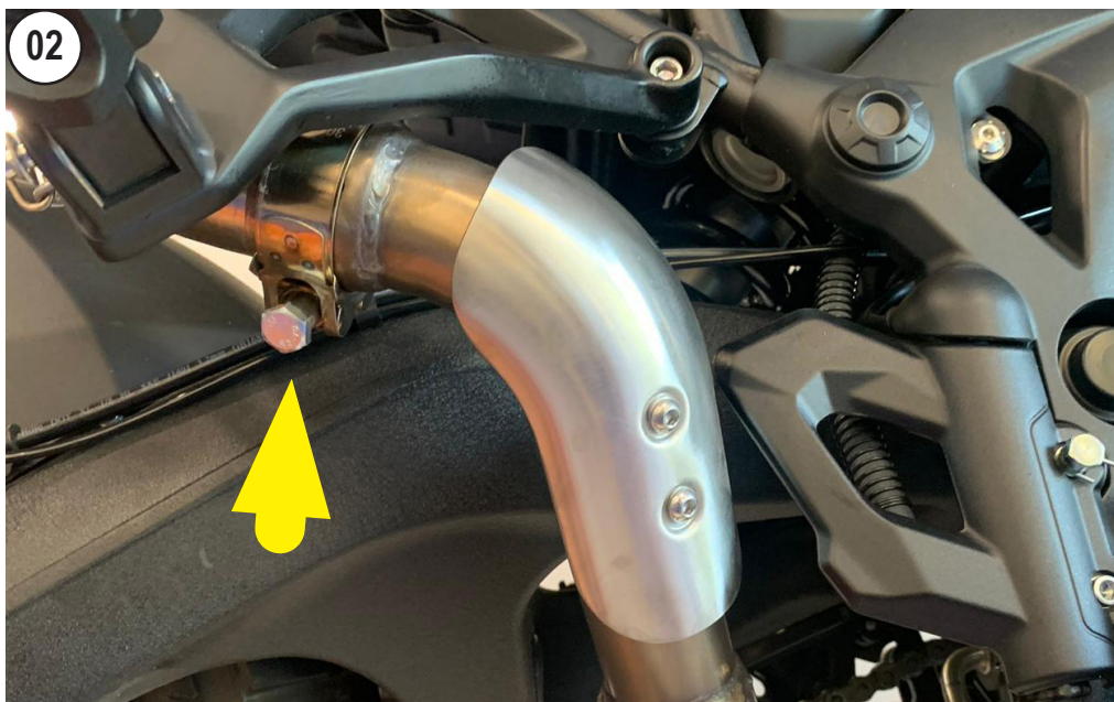
UNSCREW AND REMOVE THE STOCK PIPE