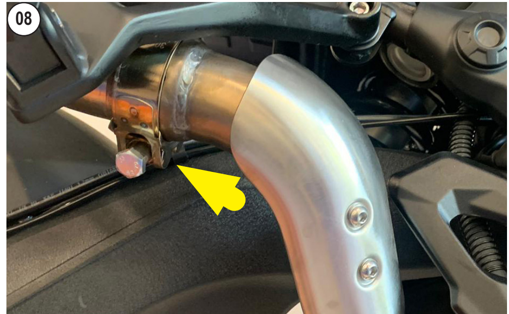
SCREW THE STOCK CLAMP