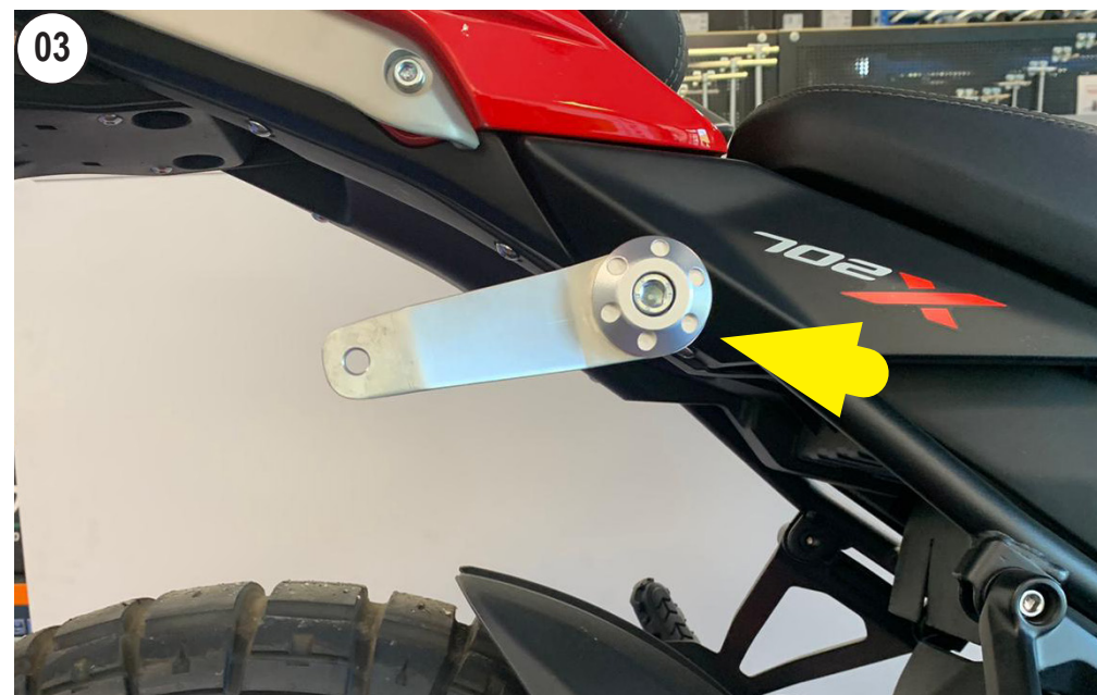
FIT THE BRACKET