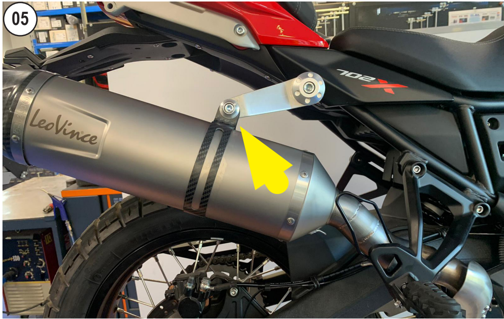
FIT THE LeoVince MUFFLER AND SCREW