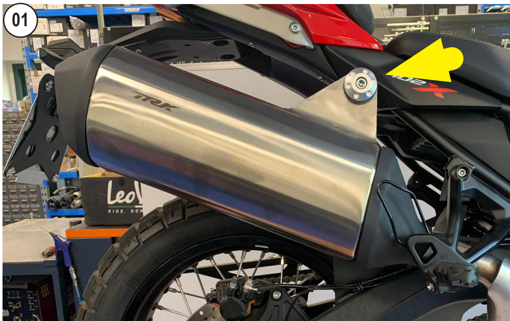
UNSCREW AND REMOVE THE STOCK MUFFLER